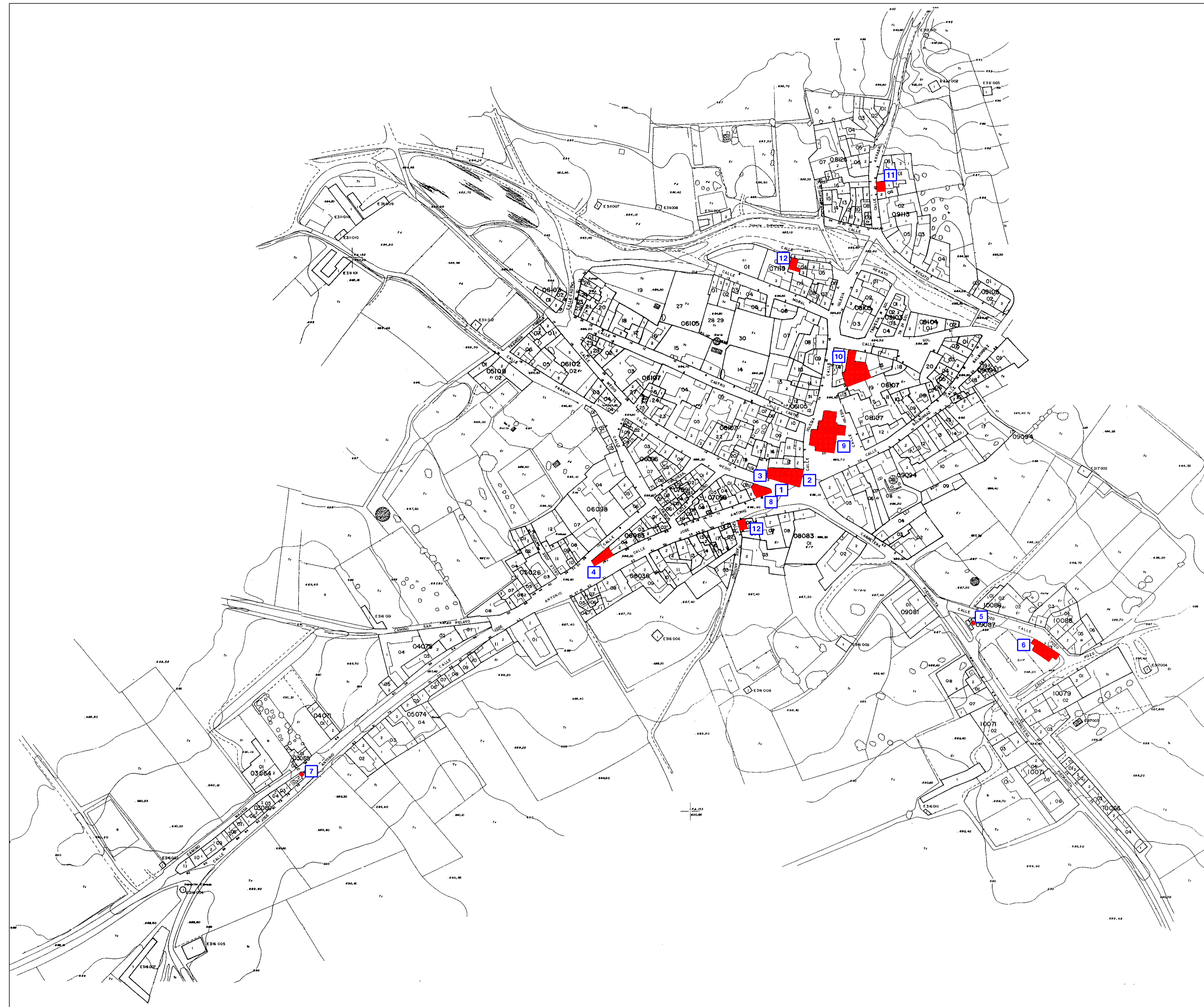
SAN CEBRIAN DE CASTRO